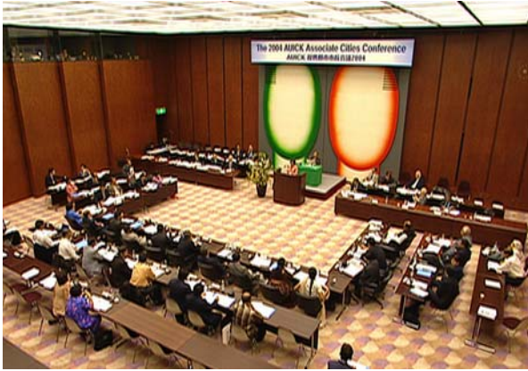
地下1階から地上5階までは国際会議場として、メインホール、国際会議室(写真)および中小会議室等を備えています。