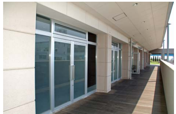
3階貸室前の通路。暖かみのあるウッドデッキ仕上げ